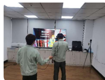
衝剪機械體作業體驗